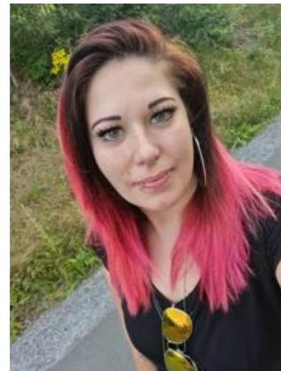
Robin-Kelly Urban Wichtel & Spatzen - Gruppe